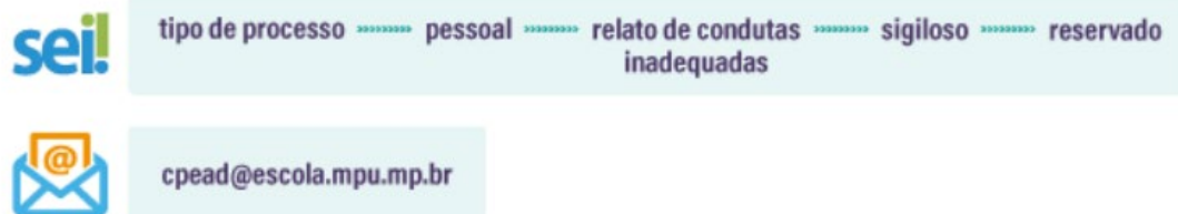
Figura 2 – Canais do SEI e da CPEAD