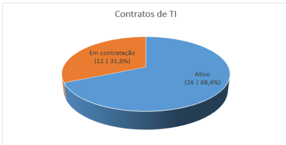
Figura 5 - Contratos Continuados de TI

A Figura 6 apresenta a visão dos contratos continuados de TI agrupados por categoria. Percebe-se que a maioria dos contratos está concentrada na área de redes e segurança (63,2%):