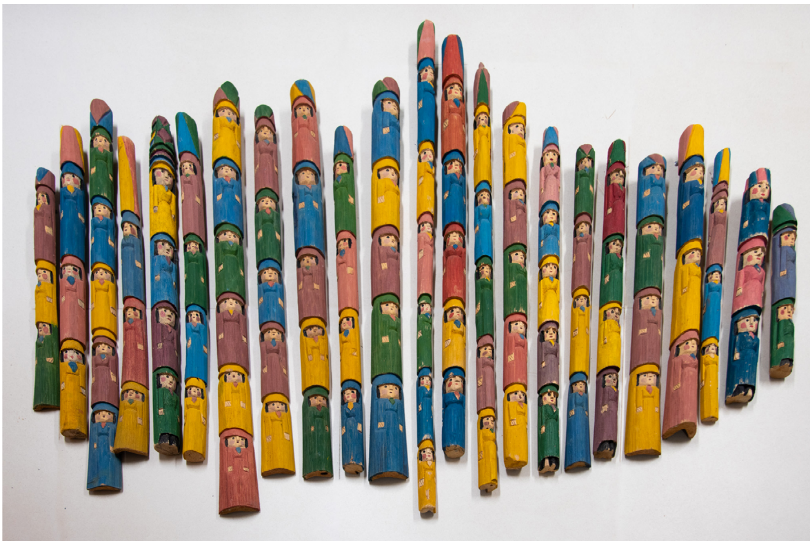
SEM TÍTULO, SEM DATA Escultura, madeira de buriti, tamanhos diversos Acervo ESMPU