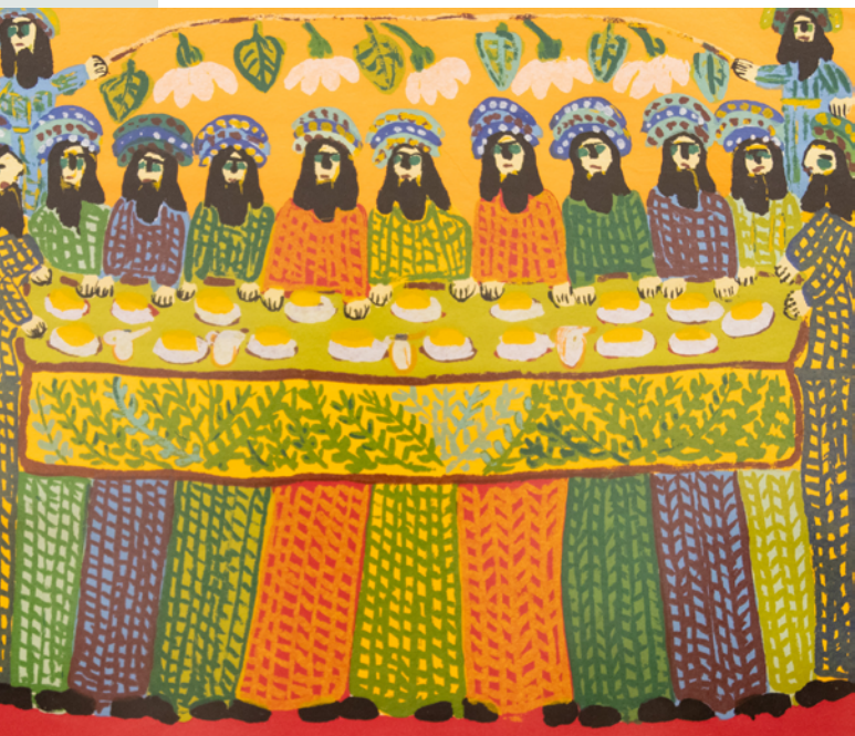
SANTA CEIA, 2004