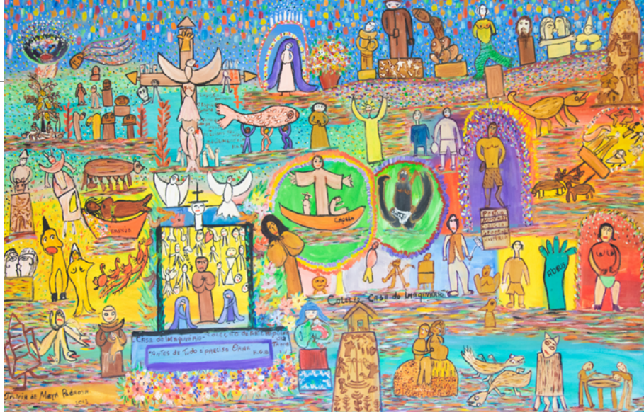
CASA DO IMAGINÁRIO, 2016