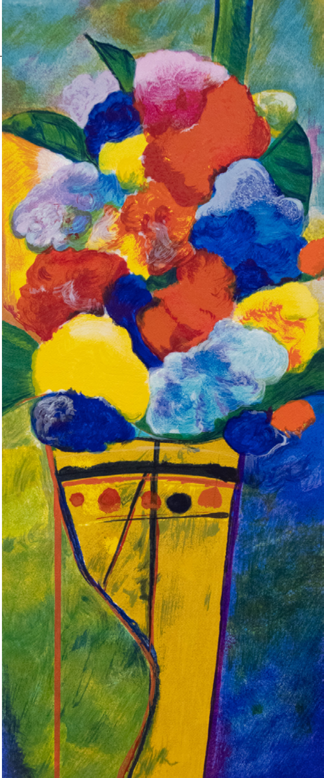
VASO COM FLORES, 2003