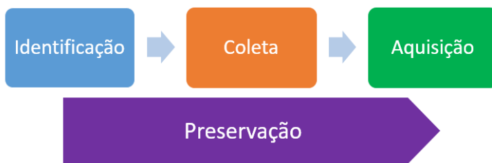
Figura 3 • Processo de tratamento forense da evidência digital NBR ISO/IEC 27037:2013

um ponto importante citado na norma que merece destaque: “recomenda-se que o processo de preservação seja iniciado e mantido durante o processo de manuseio da evidência digital, começando da identificação do dispositivo digital que contém a potencial evidência digital”. Assim, considerando essas definições, a figura a seguir ilustra, de forma macro, o processo de manuseio de evidência digital proposto pela ABNT NBR ISO/IEC 27037:2013. Destaque especial para o fato de que a preservação da evidência digital deve permear todas as etapas de manuseio do bem questionado.